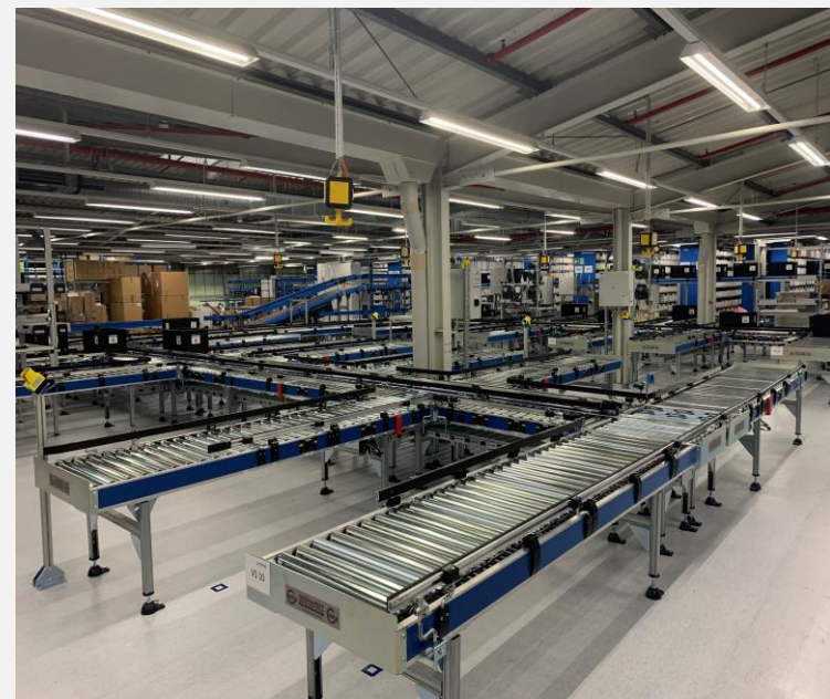
Umbau Bestandsfachbodenanlage Fördertechnik + VAS